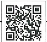
お申し込みQRコード