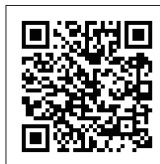
お申し込みQRコード