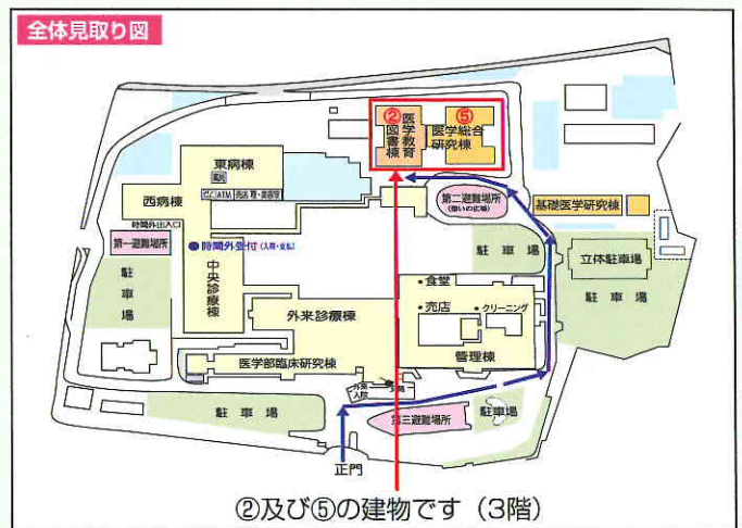
②及び⑤の建物です(3階)